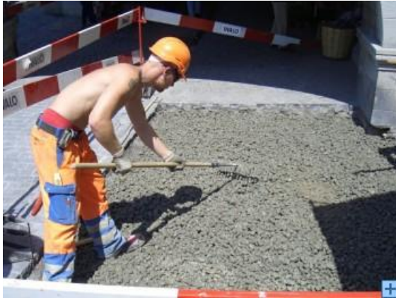
Sickerbeton als Fundament

Traditionell wurden die Pflastersteine auf einer dicken Lage Sand versetzt. Heute dient als Fundament ein Sickerbeton und als Unterlage für die Pflastersteine drei bis fünf Zentimeter Split. Die Fugen werden mit gebundenem Mörtel gefüllt.