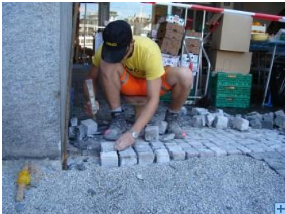
Stein für Stein Handwerk

Eine Schnur hilft dem Pflasterer, die Steine in eine gerade Linie zu bringen. Mit einem Hammer schlägt er sie in die richtige Position. Mit einem zweiten Hammer werden sie dann in die gewünschte Grösse und Form gebracht. Die Arbeit verlangt viel Präzision. Nicht von ungefähr heisst es, Pflasterer hätten intelligente Hände.