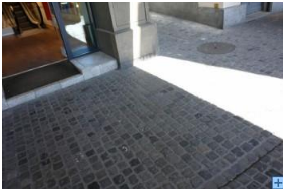
Flacher als die übliche Pflästerung