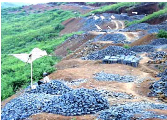
Basalt-Steinbruch von STONE HILL in Vietnam