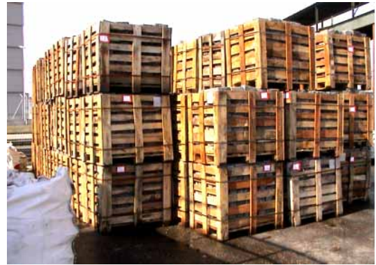
Kistenware im Lager Basel Birsfelden CH