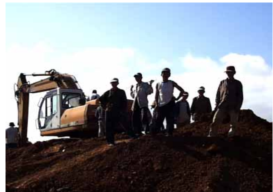
Mitarbeiter im Steinbruch in Vietnam