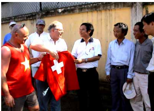
Die Schweizerischen Pflasterermeister mit AKIUCO in Vietnam