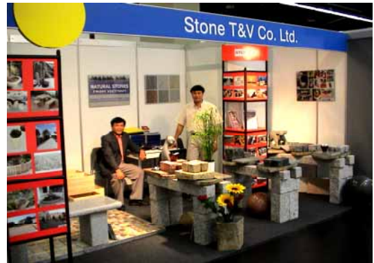
Natursteinmesse STONE+TEC in Nürnberg D mit STONE T&V