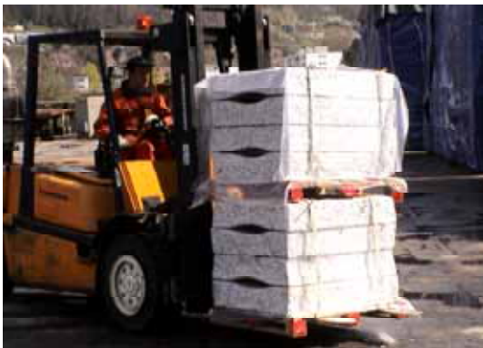
Warenumschlag im Lager Basel Birsfelden CH