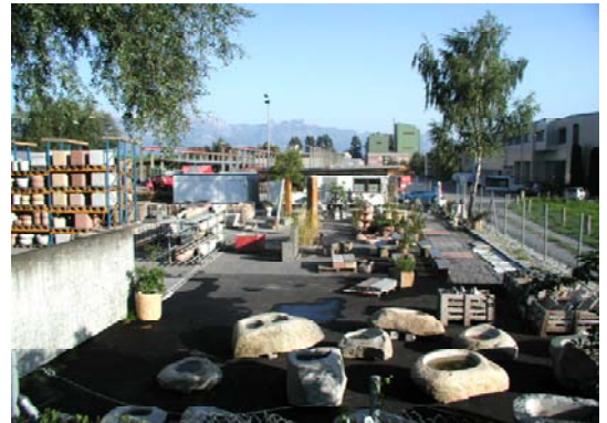
Ausstellung, Regionallager & Büro von AKIUCO AG in Triesen

AKIUCO-Produkte sind über den Natursteinhandel erhältlich. Diese Betriebe garantieren kompetente Beratung und zuverlässige Lieferung.