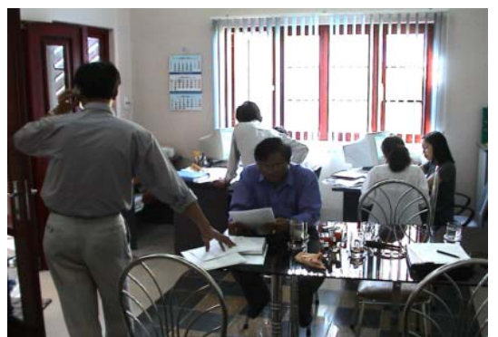
Büro STONE T&V LTD. in Vietnam