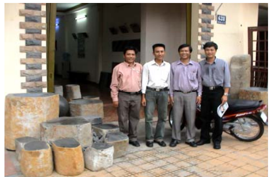
Mitarbeiter STONE HILL LTD. in Vietnam