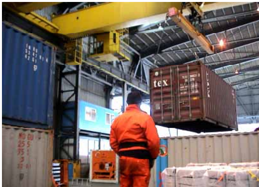
Containerankunft im Lager Basel Birsfelden CH (Birs Terminal AG)