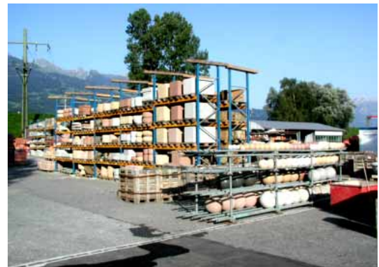
Hochregal mit Gartenmöbeln in Triesen LI